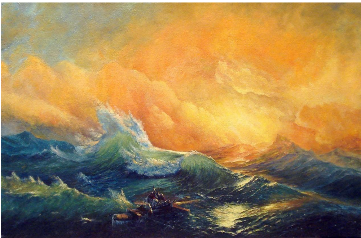
Рис.1– Картина И.К. Айвазовского «Девятый Вал» (Хранится в Русском музее в Санкт-Петербурге)

Известный в наши дни путешественник Федор Конюхов много пишет интересных картин о неживой природе, например его картина «К Мысу Горн» (демонстрация картины и фото автора на планшете).